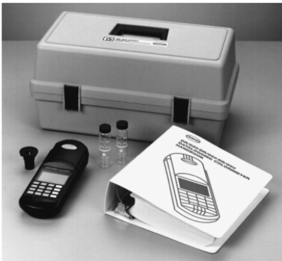
图 1 DR/800 系列色度仪标准包装*